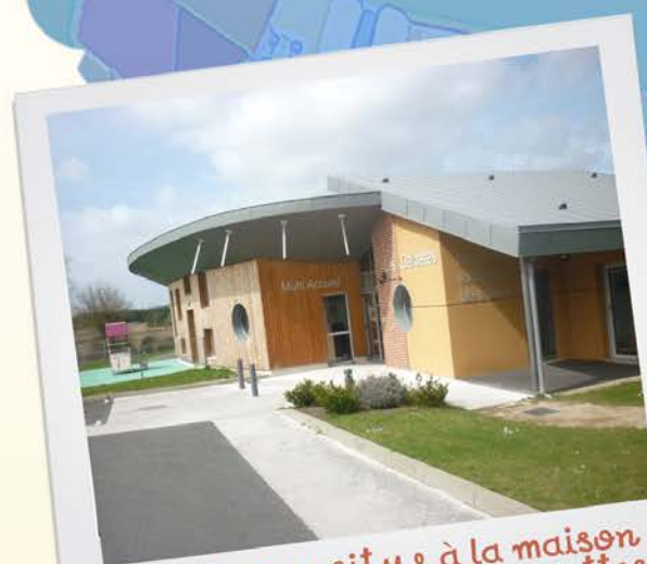
Le relais se situe à la maison petite enfance « Les Galipettes »

Aux enfants un lieu de socialisation, et d'expérimentation, à travers: des ateliers d'éveil hebdomadaires encadrés par l'animatrice du relais et des temps forts dans l'année (sorties, spectacles, éveil musical).